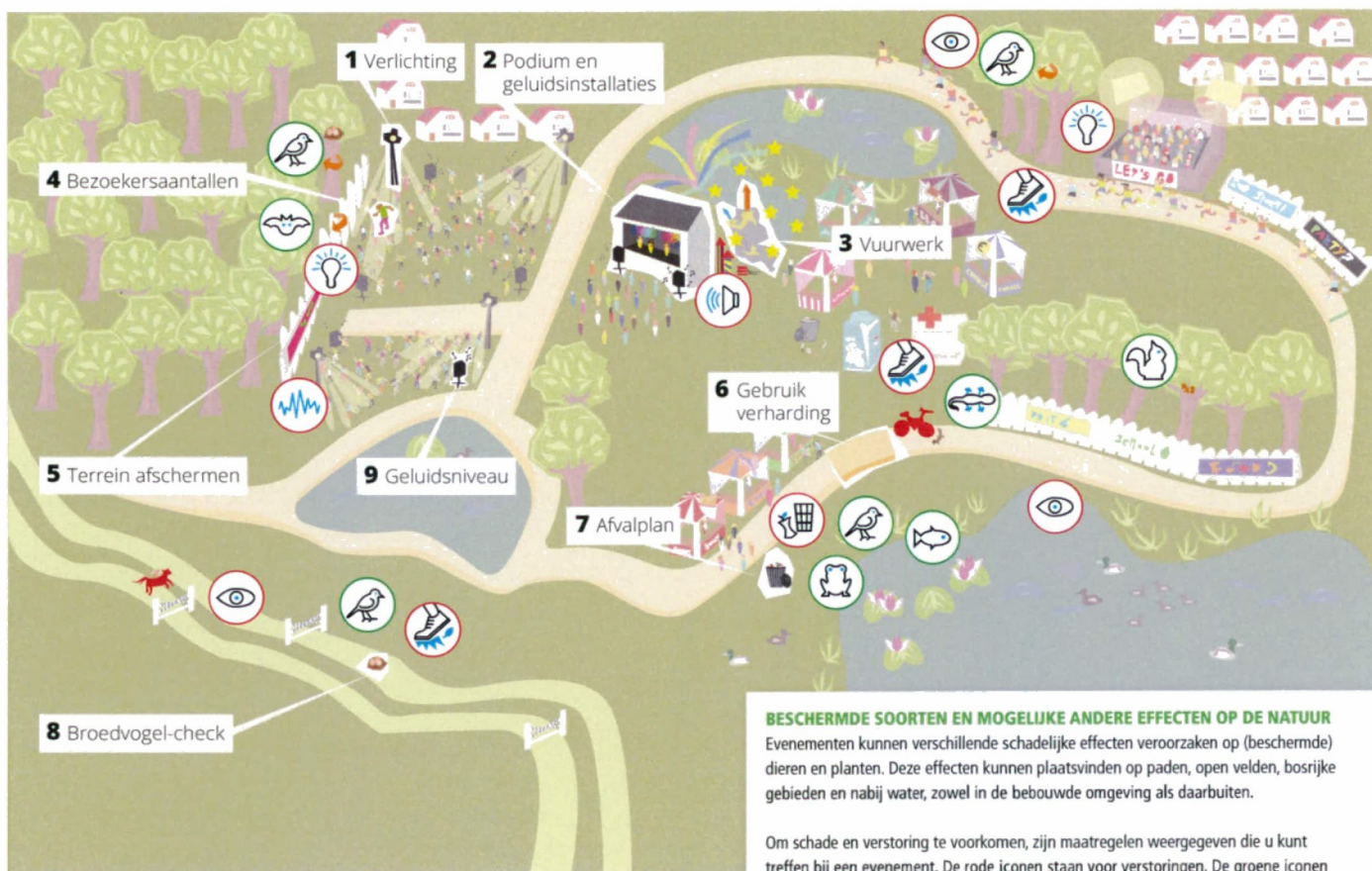
ILLUSTRATIE PROVINCIE OVERIJSEL, BROCHURE SOORTENBESCHERMING